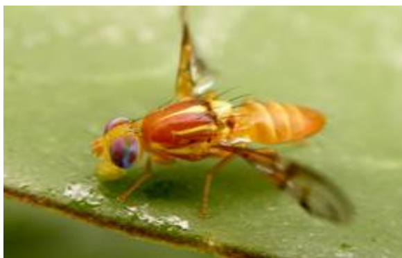
FIGURA 2 - Mosca do Gênero Anastrepha

Espécies pertencentes a esse gênero caracterizam-se pelo ápice da nervura M curvado, cerdas oclares geralmente curtas e delgadas, cerdas dorsocentrais muito próximos das cerdas pós-alares comparada com as supra-alares pós-sutural; asa em geral com padrão de faixas características denominadas C, S e V, embora em algumas espécies possam ser reduzidas ou fundidas. O ovipositor é alongado e tubular com lobos laterais na base; a membrana reversível é expandida basalmente apresentando dentes na parte dorsal; o acúleo é longo, estreito e esclerotizado (NORRBOM, 2000b) (Figura 2).