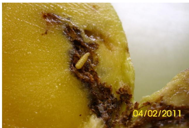
FIGURA 4 - Dano causado pelas moscas-das-frutas

Os principais danos causados por Anastrepha spp. são decorrentes da oviposição em frutos ainda verdes, provocando o seu murchamento antes de atingirem a maturação. (MEDINA et al., 1980).