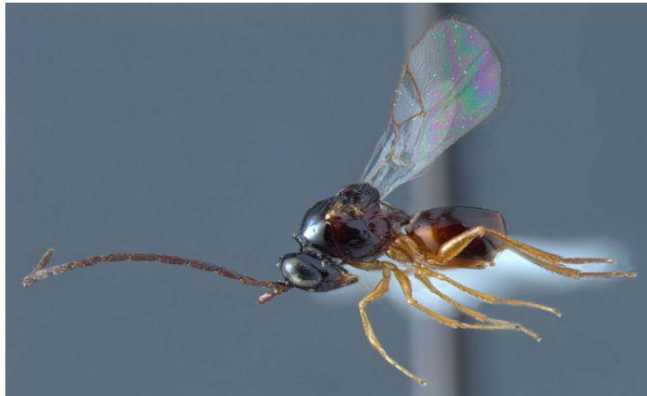
FIGURA 7 - Aganaspis pelleranoi (Hymenoptera, Figitidae: Eucoilinae)

No Brasil, são conhecidos aproximadamente 29 gêneros e 55 espécies de Eucoilinae no Brasil, dentre as quais 11 espécies em seis gêneros são parasitoides de dípteros da superfamília Tephritoidea. Devido ao número reduzido de amostras de eucoilíneos examinados no Brasil, torna-se prematuro o estabelecimento preciso da distribuição das espécies, porém é bastante provável que estes parasitoides estejam presentes em todos os locais de ocorrência dos tefritídeos (MALAVASI e ZUCCHI, 2000).