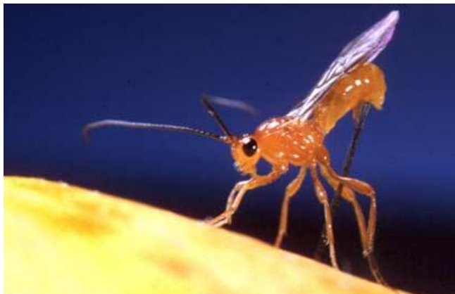
FIGURA 6 - Doryctobracum areolatus (Hymenoptera, Braconidae: Opiinae)

A importância dos braconídeos como agentes de mortalidade de moscas-das-frutas, avaliada através dos níveis de parasitismo natural, foi estudado por vários autores no Brasil (LEONEL et al., 1996; SALLES, 1996).