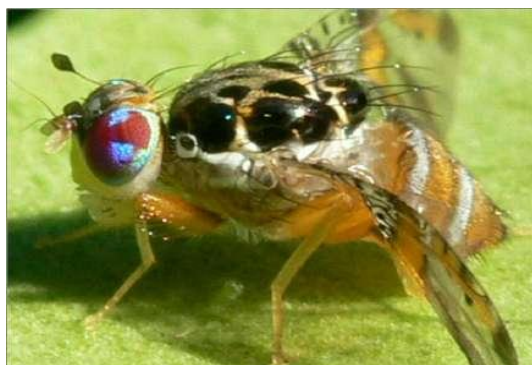
FIGURA 1- Mosca do gênero Ceratitis

O gênero Ceratitis é constituído por 70 espécies. Conhecida como mosca-do-mediterrâneo, Ceratitis capitata é a única espécie deste gênero que ocorre no Brasil sendo considerada a mais amplamente disseminada e adaptada a ambientes rurais (MORGANTE, 1991) (Figura 1).