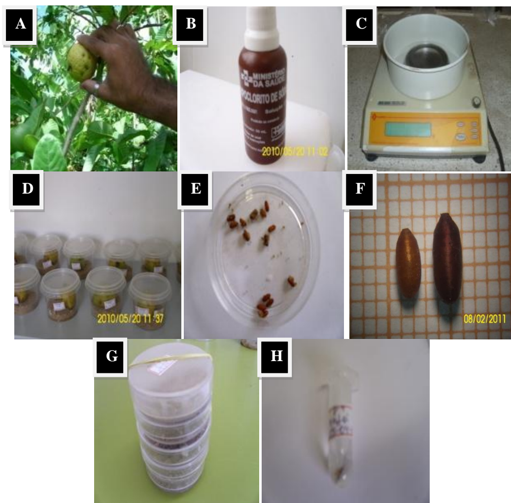
FIGURA 8 - A) coleta dos frutos; B) higienização com hipoclorito de sódio; C) pesagem; D) acondicionamento; E) obtenção das pupas; F) individualização para as pupas de Ceratitis capitata e Anastrepha spp.; G) acondicionamento dos adultos., H ) adultos conservados em álcool a 70% (Laboratório de Entomologia – Ceca/Ufal – abril de 2010 a outubro de 2010).

O parasitismo foi calculado pela fórmula: P = \frac{\text{pupas parasitadas}}{\text{total de pupas}} \times 100 (Margolis et al., 1982; Bush et al., 1997), pois os parasitóides parasitam as larvas e emergem nas pupas (parasitóide larva-pupa).