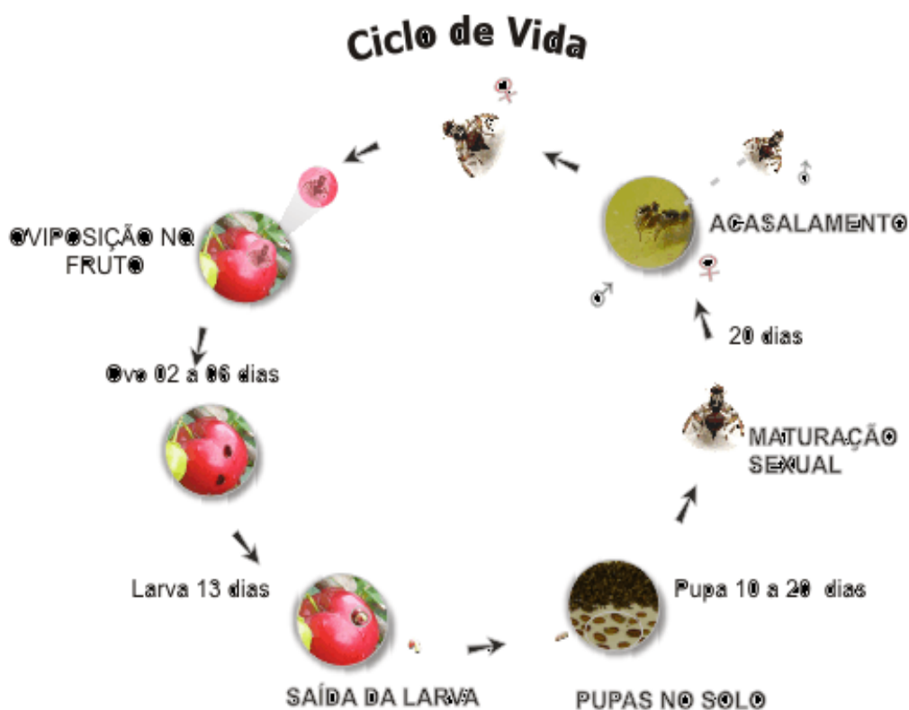
FIGURA 5 - Ciclo biológico das moscas-das-frutas

As moscas-das-frutas apresentam quatro estágios em seu ciclo de vida: ovo, larva, pupa e, adulto (macho ou fêmea). As fêmeas sexualmente maduras e, fertilizadas efetuam a postura, diretamente nos frutos onde, após a incubação dos ovos, as larvas eclodem e vivem até a pré-pupa. As pré-pupas saem dos frutos caem no solo, onde pupam e permanecem a uma profundidade que varia de 2 a 20 cm, quando emergem originam os adultos. O ciclo é completado de 26 a 30 dias a uma temperatura de 25° C (SALLES, 1993) (Figura 5).